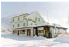
Restaurant Sonne Familie Exposito