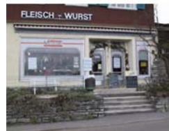
Metzgerei Laternser O. und R. Laternser