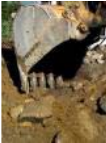
Gebrüder Alpiger AG